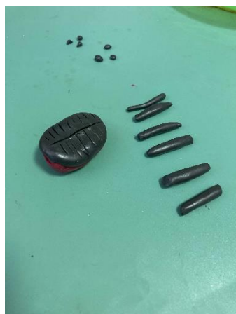
Стекой наносим насечки одну продольную и много поперечных