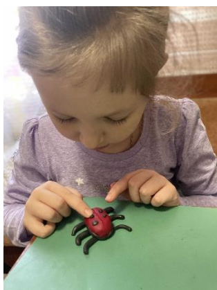
Переверните тело жучка прикрепите на спинку черные точки