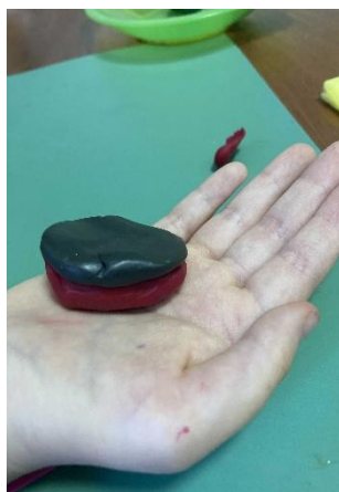
Соединяем одну деталь с другой получаем тело жука