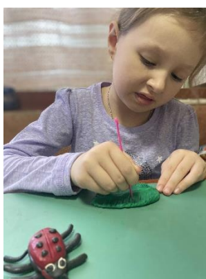
Делаем листочек для нашей божьей коровки