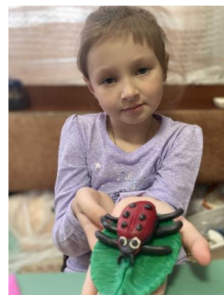
Божья коровка из пластилина готова