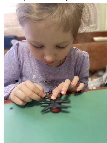
Прикрепите лапки к телу жучка по 3 с каждой стороны