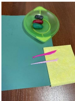
Выбор цветов пластилина для лепки