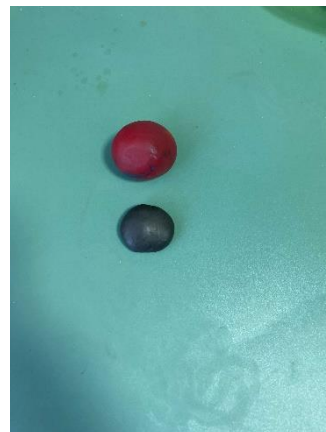
Из черного кусочка круглая лепешка из красного шарик