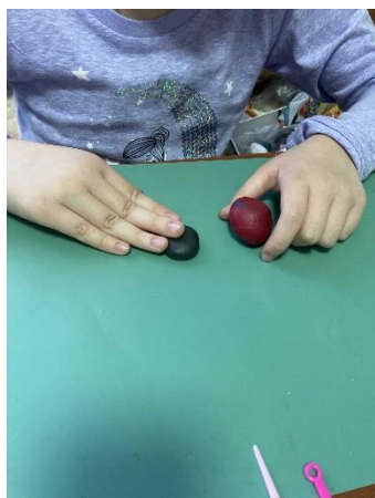
Размять оба цвета пластилина в руках